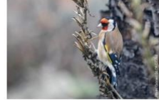
chardonneret, bouvreuil pivoine , perruche à collier, pic vert, mésange

"Le 28 janvier dernier a eu lieu le comptage des oiseaux de jardin. Mais ce jour là, à part les habituelles mésanges bleues et charbonnières, les oiseaux de mon jardin sont allés se faire voir ailleurs.