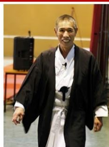
10 ans, déjà ...

Institut du Judo - Paris 14° le 25 février